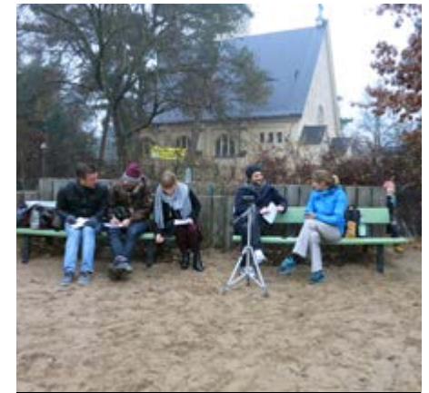
KONTEXTUELLE USER RESEARCH