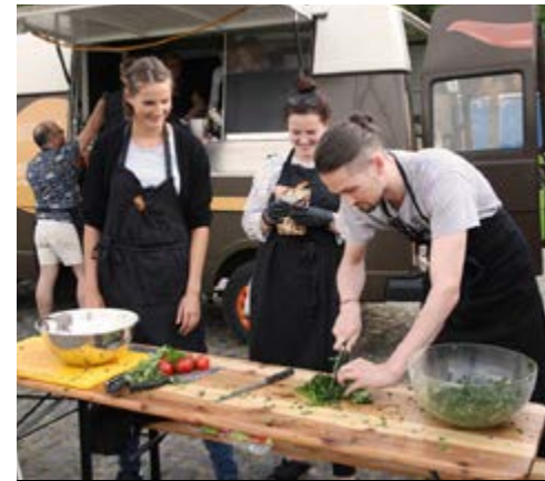
TEAMEVENT MIT REFOODGEES